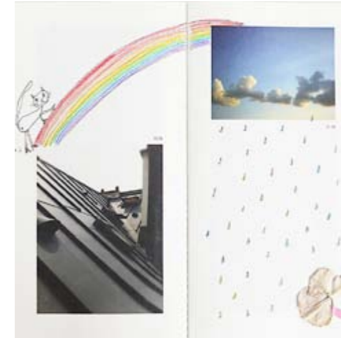
Carnet 06 (Juin) // Masae Takanaka

Extraits de Carnets d'Images illustrés :