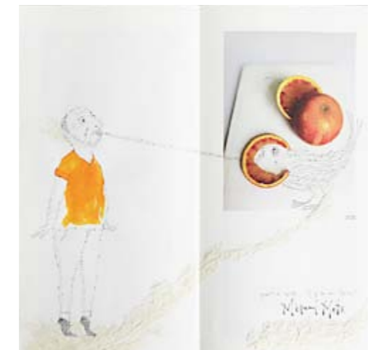
Carnet 03 (Mars) // Megumi Terao